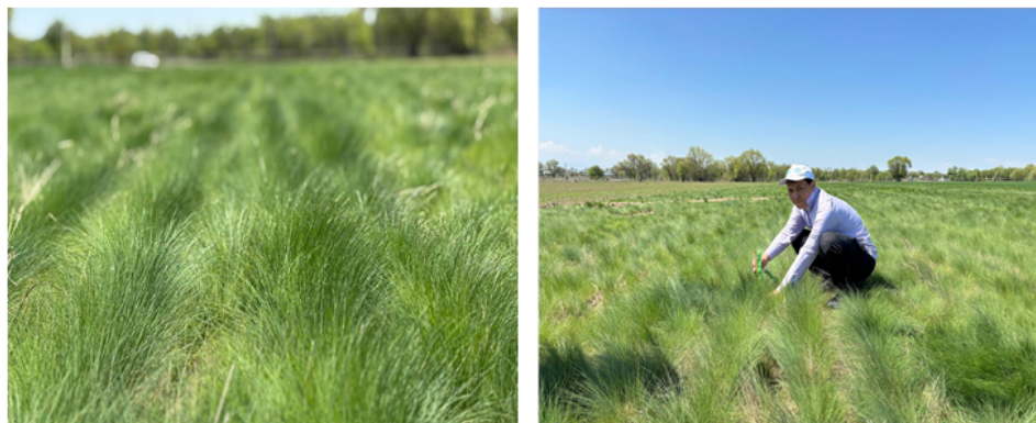
Рисунок 1. Питомник конкурсного сортоиспытания типчака ( Festuca valesiaca Schleich. ex Gaudin).