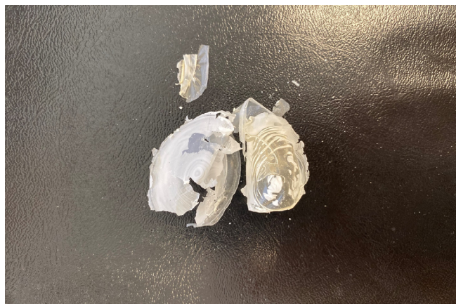
Рисунок 3. Плёнка ПГБ, экстрагированная из штамма B. aryabhattai RAF 5.

В ходе исследования температура плавления ПГБ, синтезированного штаммом B. aryabhattai RAF 5, определялась с использованием прибора для измерения температуры плавления (Fisher – Johns, Melting Point Apparatus, США). Температура плавления образцов ПГБ, полученных от Sigma-Aldrich, и выделенной бактериальной плёнки оказалась схожей и составила 175 °С, что может